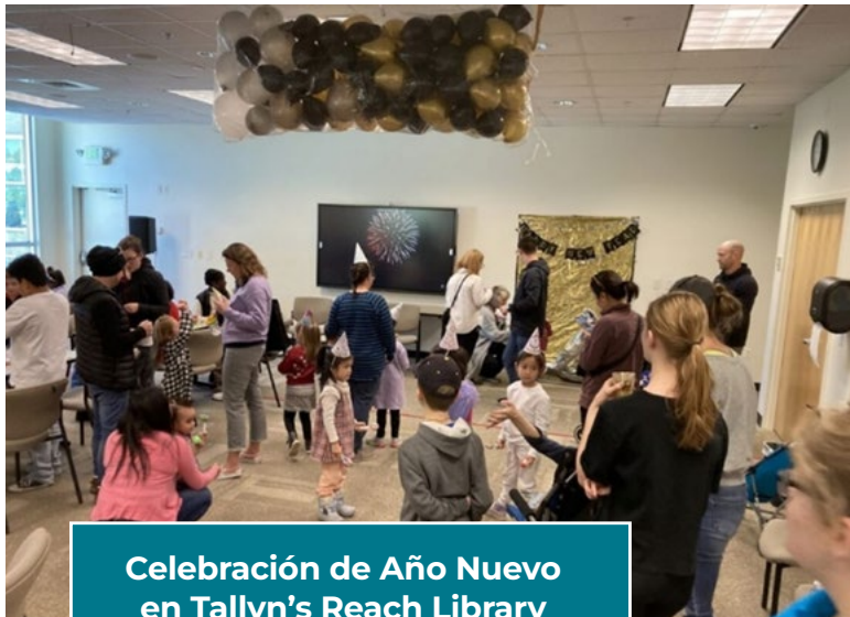
Celebración de Año Nuevo en Tallyn's Reach Library