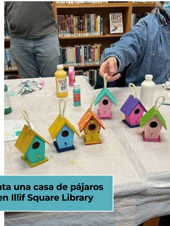
Pinta una casa de pájaros en Illif Square Library