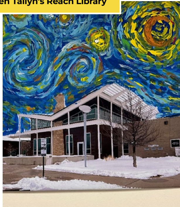
Pinta como profesional en Tallyn's Reach Library