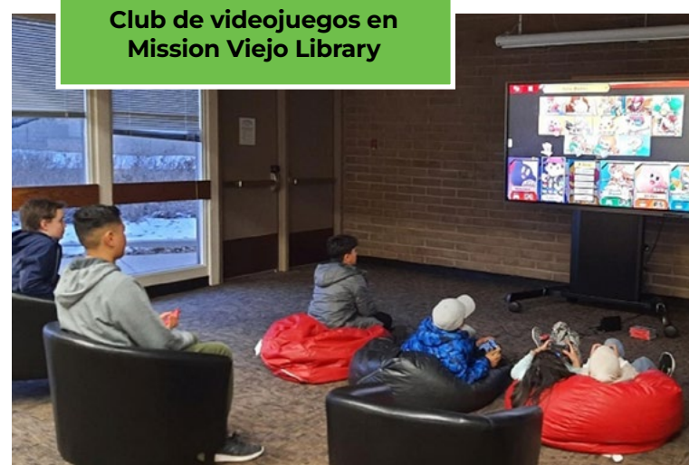
Club de videojuegos en Mission Viejo Library